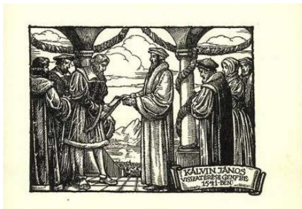
Képeslap a Szerencsi Múzeum gyűjteményéből

„És így mindannyian megvallották, hogy semmi kormányzati formát sikeresen be nem lehet hozni, ha csak elsősorban a vallásosságra nem fordítanak gondot, és hogy balgatagok azok a törvények, amelyek Isten jogát figyelmen kívül hagyván, csupán az emberekről gondoskodnak.”