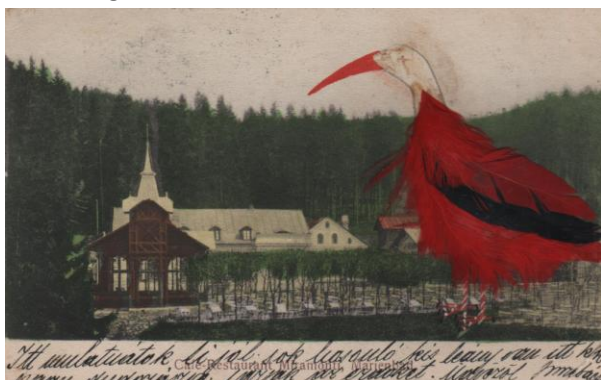
Ezen a XX. század eleji lapon a rajta lévő madár valódi tollakkal „ékeskedhet”

haj, kiszáritott havasi gyopár, s láthatunk így kisebb gyöngyöket, csillámot, műanyag díszeket. Hasonlóképpen a tapintás a hangsúlyos azoknál az üdvözlő vagy városképes lapoknál is, amelyeket dombornyomással készítettek: ezeknél nincs ráragasztott anyag, viszont háromdimenzióssá válik az adott hegyvonulat, háztáji állat vagy ornamentikai díszítés. Az utóbbi évtizedek talán legfelkapottabb, ide sorolható típusa a hímzett ruhákat, kis viseleteket bemutató lapok összessége.