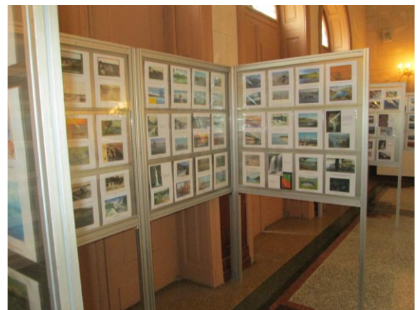
Acsád –kiállítási részlet