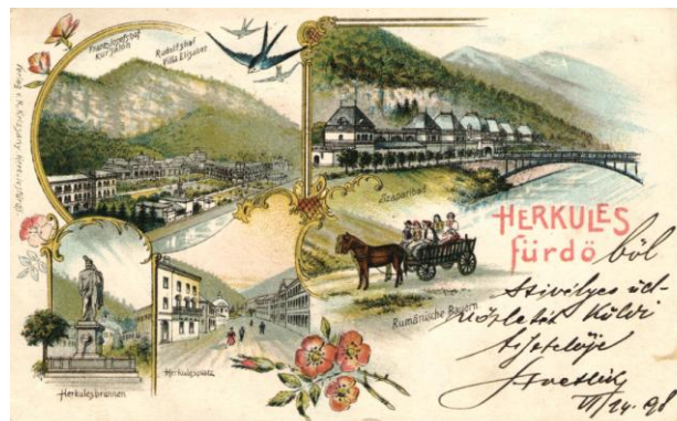
Herkulesfürdő. 1898.

A fiumei a híres kikötőt és a korzót mutatja, a nagyszebeni rajzon pedig a város távlati képe, valamint a Grosser Ring látható, előtérben egy vonattal. A pöstyéni lapon a város panorámája, a fürdőépületek és a fürdőkocsi látható.