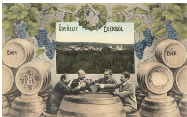
Egri képeslap. 1910-es évek (ZM)

Az 1897/98-as években 4-6, sőt 8 részletképből is állt egy-egy illusztráció, és már csak a lap jobb alsó sarkában maradt hely néhány üdvözlő szónak. Ezért a 20. század első éveiben többen javasolták, hogy a képes levelezőlapok címzési oldalán legyen helye az üzeneteknek, így a másik oldalra csak az illusztrációk kerülhetnének. A címzési oldal megosztását Angliában 1902-ben, Németországban 1904-ben engedélyezte a posta. Magyarországon 1905-ben már megosztott hátoldalú képeslapok készültek. A képeslapok hátoldalának megosztása - mint korszakhatár – a dátum nélküli képeslapok korának meghatározásához is segítséget nyújt.