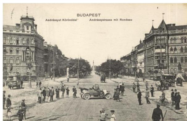
Budapesti utcakép járművekkel és emberekkel. 1914-1917.

Országházat. A kulturális célú épületek (múzeumok, színházak) és a kereskedelmi, vendéglátó létesítmények (szállodák, üzletek, vendéglők) mellett számtalan képeslap örökíti meg a bérpalotákat, utcaképeket a lüktető Belváros (Kálvin tér, Kerepesi út, Nagykörút) forgalmát a lovas kocsikkal, omnibuszokkal és villamosokkal.