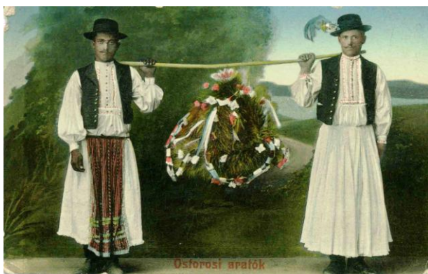
Ostorosi legények aratókoszorúval (BSK)

Az egyes településeket sújtó természeti katasztrófákról, tüzesetekről is azonnal készültek képes levelezőlapok, hiszen ez a műfaj képes hírközlőként is szolgált. Így levelezőlapot adtak ki a budapesti Párizsi Áruház 1903. augusztus 24-i leégéséről, az 1904-es és 1917-es gyöngyösi tűzvészről. Ez utóbbi alkalmából IV. Károly király és Zita királyné is meglátogatta a várost, amelyről képeslap sorozat jelent meg. Az 1896-os budapesti ezredéves kiállításra adta ki a Magyar Posta 32 lapból álló millenniumi képeslap sorozatát, majd a vidéki városokban szervezett mezőgazdasági, ipari és képzőművészeti kiállításokat is sorra megörökítették képes levelezőlapokon. PETERCSÁK TIVADAR