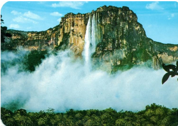
Venezuelában van az Angel-vízesés, mely a legnagyobb a világon, 1004 méter magas