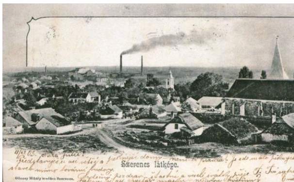
Szerencs látképe a cukorgyárral. 1903. (ZM)

Az ipari létesítményeket, gyárakat és bányákat megörökítő képeslapok az 1880-as évek végétől ismertek. Ezek ma már az ipartörténeti kutatások pótolhatatlan dokumentumai. Sok esetben régen megszűnt vagy olyan kis helyen működött üzemről tudósítanak, amelyeknek ezek az egyedüli ábrázolásai. A gyár a településnek éppen olyan nevezetessége volt, mint a templom vagy még fontosabb, mert sok esetben ettől vált országos hírvé (pl. szerencsi cukorgyár, borsodnádasi lemezgyár). Ma már csak képes levelezőlap őrzi a nagytályai vízimalmot.