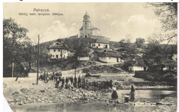
Rakacai falukép. 1920-as évek (ZM)

A falvak közül egy rakacai képeslapot emelek ki, amely a két világháború között készült a görög katolikus templomról, de több értékes információt is tartalmaz. A templom előterében a domboldalon épült lakóházak zöme szalmával lépcsőzetesen fedett, és van közöttük archaikus típusú, a legszegényebb családokra jellemző szoba, pitvar beosztású ház is. Az előtérben korabeli öltözetben a falusiak nagy csoportja látható felnőttekkel és gyerekekkel. Néprajzi kuriózum, hogy két asszony súlykolófaival vásznat mos a kőgáttal elrekesztett patakban. Ugyancsak egyedülálló az egri külvárosok paraszttasszonyai által használt melegvízi mosodáról készült lap.