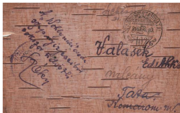
Nyírfakéregből készült tábori levelezőlap (1916)

leglátványosabban az alakjukban, méretükben újító képeslapok azok, amelyek bármely turisztikai központ árusainál is postázásra csábíthat bennünket: formálhatják pl. egy malac fejét, vagy egy trópusi országban nem ritkán egy helyinek számító gyümölcsöt. Arra számítanunk kell, hogy ha fel is adjuk, elég ritkán érnek célba „töretlenül”. Lehet extrém módon kicsi is, akkora, hogy egy rendes bélyeg mellé a címzés és a szöveg épp hogy elfér.