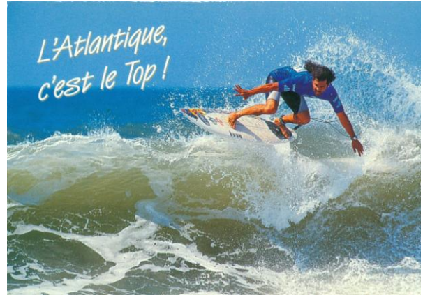
Hullámlovag a francia partoknál

vízben él, míg egy másik részük a vízben élő állatokból és növényekből táplálkozik. Ez természetesen az emberre is vonatkozik. Az emberiség történelmében a víz az egyik jelentős közlekedési felület volt, és még napjainkban is meghatározó. Modern világunkban a víz a sportolás és szórakozás egyik eszköze.