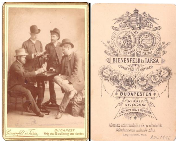
Keményhátú visit fotó, előoldal (recto) és hátoldal (verso). Fényképész: Bienenfeld és Társa fényképészeti műterem, Budapest, Király utca 25 sz. 1890 körül.

Ennek köszönhetően már a '20-es évek elejére a több mint fél évszázada használatban lévő visit, cabinet vagy más fantáziánéven elnevezett keményhátú fotókat kiszorították a forgalomból.