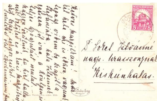
Osztott hátlapú fényképes képeslap. Kiadó: Monostory György, Budapest, 1925.

A másik csoportba tartoznak azok a ma már kevésbé ismert, zömében személyes hangvétellű fényképes levelezőlapok , melyek az 1900-as évek elején a fényképek és a képes levelezőlapok egyesüléséből jöttek létre.