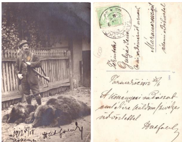
Fényképes levelezőlap (levelezőlap-osztásos hátlappal rendelkező fénykép). Kiadója nincs, készítője ismertelen. 1912.

A fényképes levelezőlapok már megjelenésükkor népszerűek voltak. Felkapottságukat leginkább annak köszönhetjük, hogy fényképeik, egyedi stílusban készültek, olcsóbbak voltak a hagyományos fényképekénél, és a posta is kedvezőbb áron kézbesítette, mint a leveleket.