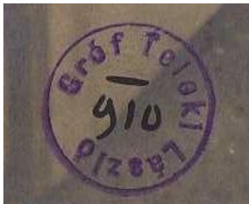
1. ábra: A képeslapon található tulajdonosi pecsét nagyított formában.