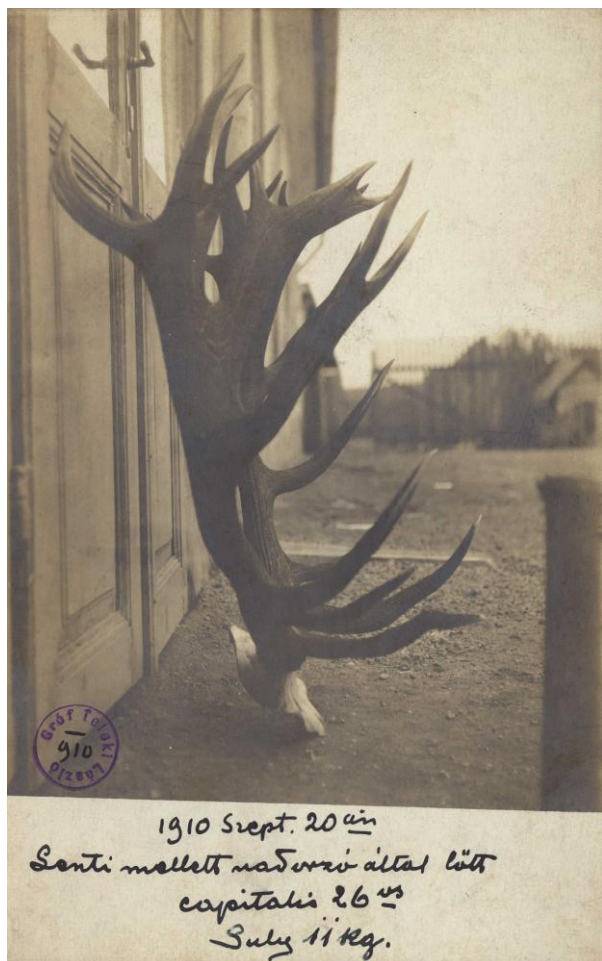
2. ábra: A képeslapon Lenti mellett 1910. szeptember 20-án orvvadász által meglőtt kapitális gímbika agancsát láthatjuk. Osztott hátlapú, nem futott, fekete-fehér képes levelezőlap (fotólap) 1910-ből.

Gyűjteményem részét képezi az a képes levelezőlap (fotólap), melynek képoldalán egy nem szokványos feliratú bélyegző lenyomata található. A kép bal alsó sarkában található az az ibolya színű, 12 mm átmérőjű, kör alakú bélyegző lenyomata, aminek a belső körívét követve nyomtatott betűvel Gróf Teleki László neve olvasható. A lenyomat közepébe fekete tintával és kézi írással 1910-es évszám olvasható (1. és 2. ábra).